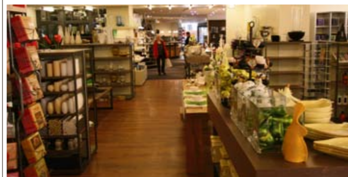
Anspruchsvolle Tisch-Dekoration im Lenffer Premium Store in unmittelbarer Nähe des Hamburger Rathauses

gründige: die Verkaufsräume von Lenffer am Großen Burstah wurden hochwertig modifiziert, laden ein zum Verweilen, zum Staunen und zum Ausschauen. Doch das, was nicht auf den ersten Blick auffällt, bringt Leben und die besondere, zugewandte Atmosphäre in das Geschäft: die Mitarbeiter. Während andere Unternehmen immer weniger Verkäufer